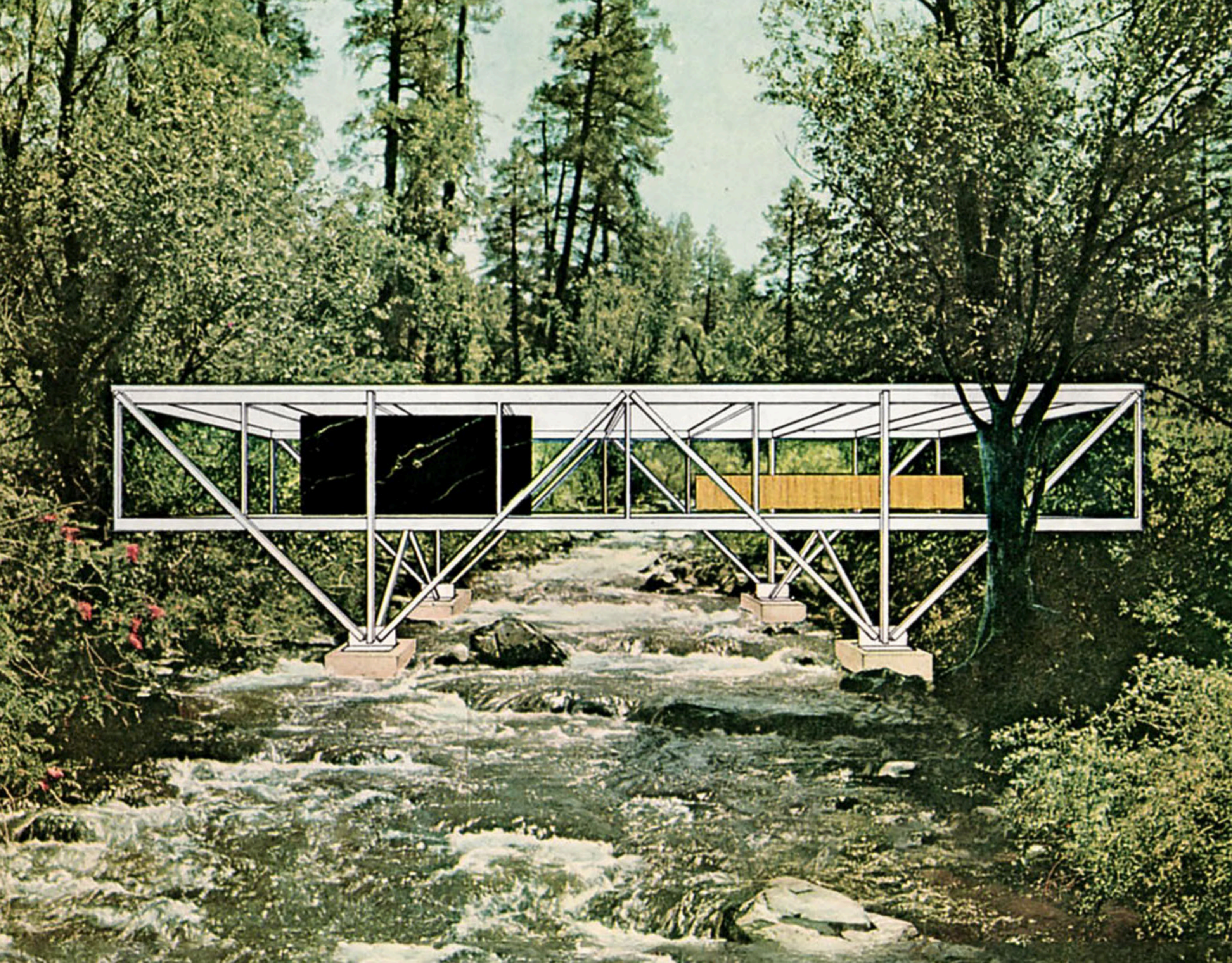
Ilustração: Bridge House [1968] Craig Ellwood.