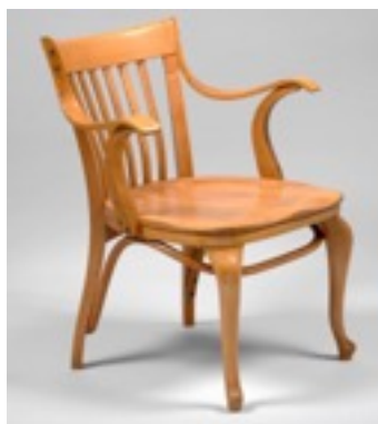
N152 Silla de brazo del Café Capua, 1913 Adolf Loos Colección Hummel, Viena.