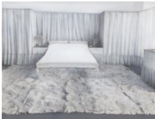
Habitación Lina Loos The Albertina Museum, Vienna