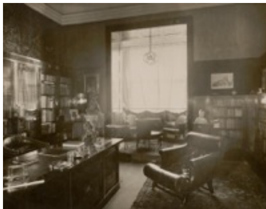
Despacho Casa Friedman The Albertina Museum, Vienna