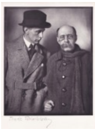
N132 Fotografía de Adolf Loos con Peter Altenberg, 1930 Trude Fleischmann Colección Hummel, Viena.