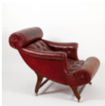
N135 Butaca, 1907 Utilizada por Adolf Loos / F.O.Schmidt Colección Hummel, Viena.