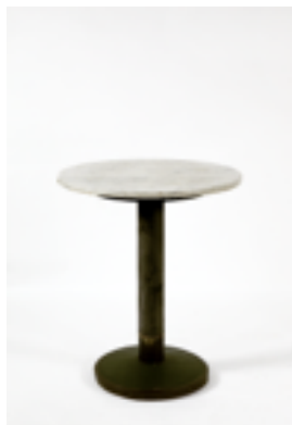
N149 Taula, 1913 Adolf Loos (atribuida) Colección Hummel, Viena.