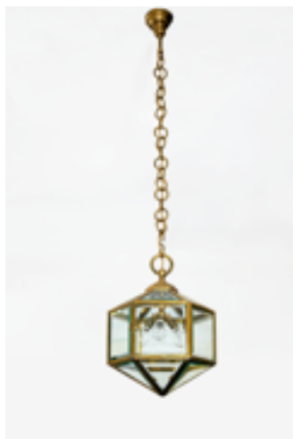
N139 Lámpara de techo, 1905-1913 Adolf Loos Colección Hummel, Viena.