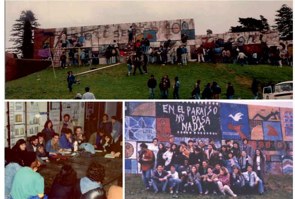
Encontrazo, Montevideo, Uruguay, 1990

Dentro de este encuentro habrán actividades de tipo cultural, de trabajo en equipo y de proactividad, orientadas a generar un aporte en Colonia, en retribución de lo que la ciudad nos enseña. Además habrán presentaciones, conferencias y exposiciones que promueven la integración, el intercambio de realidades y conocimientos entre el estudiantado de los distintos países de la región. Dicho encuentro convocará alrededor de 2000 estudiantes.