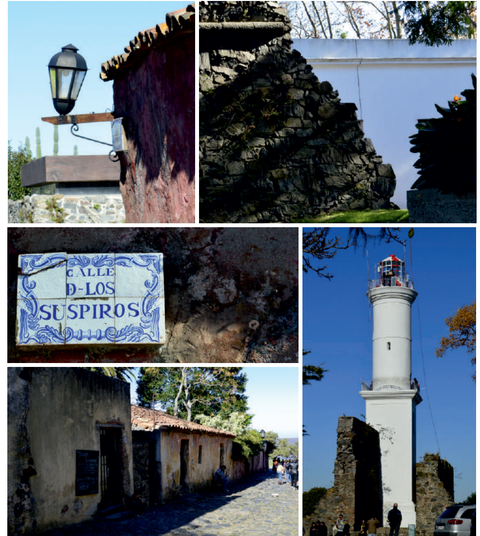
Uruguay, Colonia del Sacramento.

Pretendemos de este ELEA, estudiantes conscientes, reflexivos, críticos a nuestra historia y a nuestra Latinoamérica, para que una vez mas encontrarnos sea dejar huella.