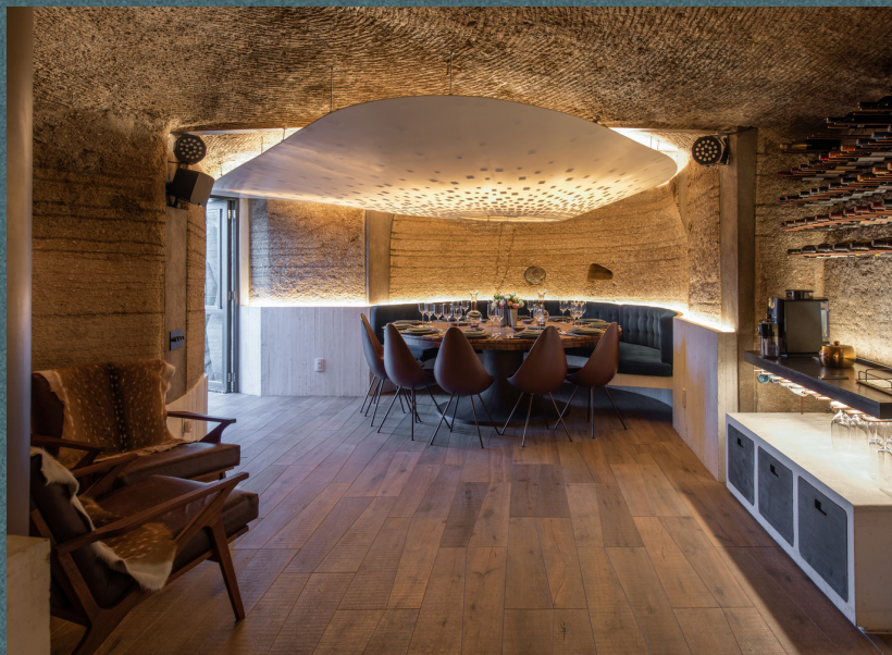
Cueva Fotocatalítica MM

2006 / CIUDAD DE MÉXICO / BGP ARQUITECTURA_AT103