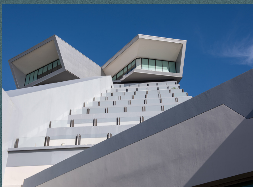
Showroom y ampliación Park Royal Cancún