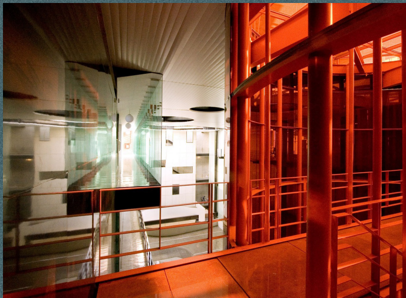
Estación de Bomberos Ave Fenix

2006 / CIUDAD DE MÉXICO / BGP ARQUITECTURA_AT103