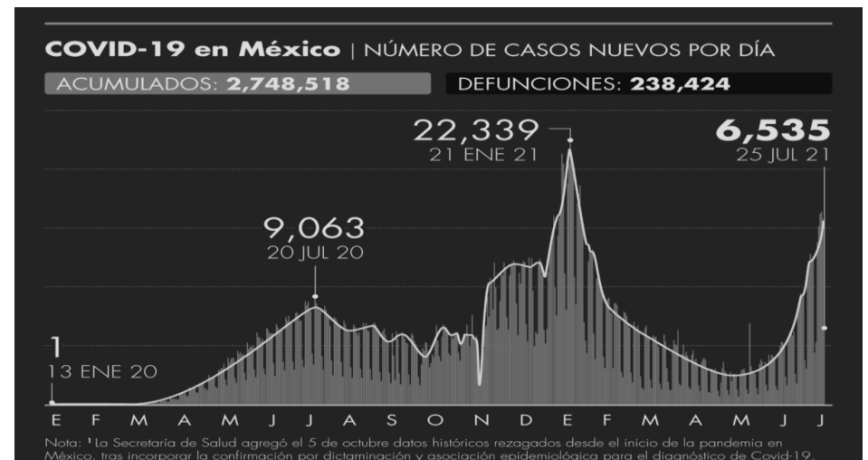
Gráfica del comportamiento de la pandemia en México SSA, México 2021