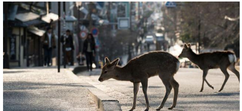
La naturaleza recuperando territorios temporales Autor desconocido 2020