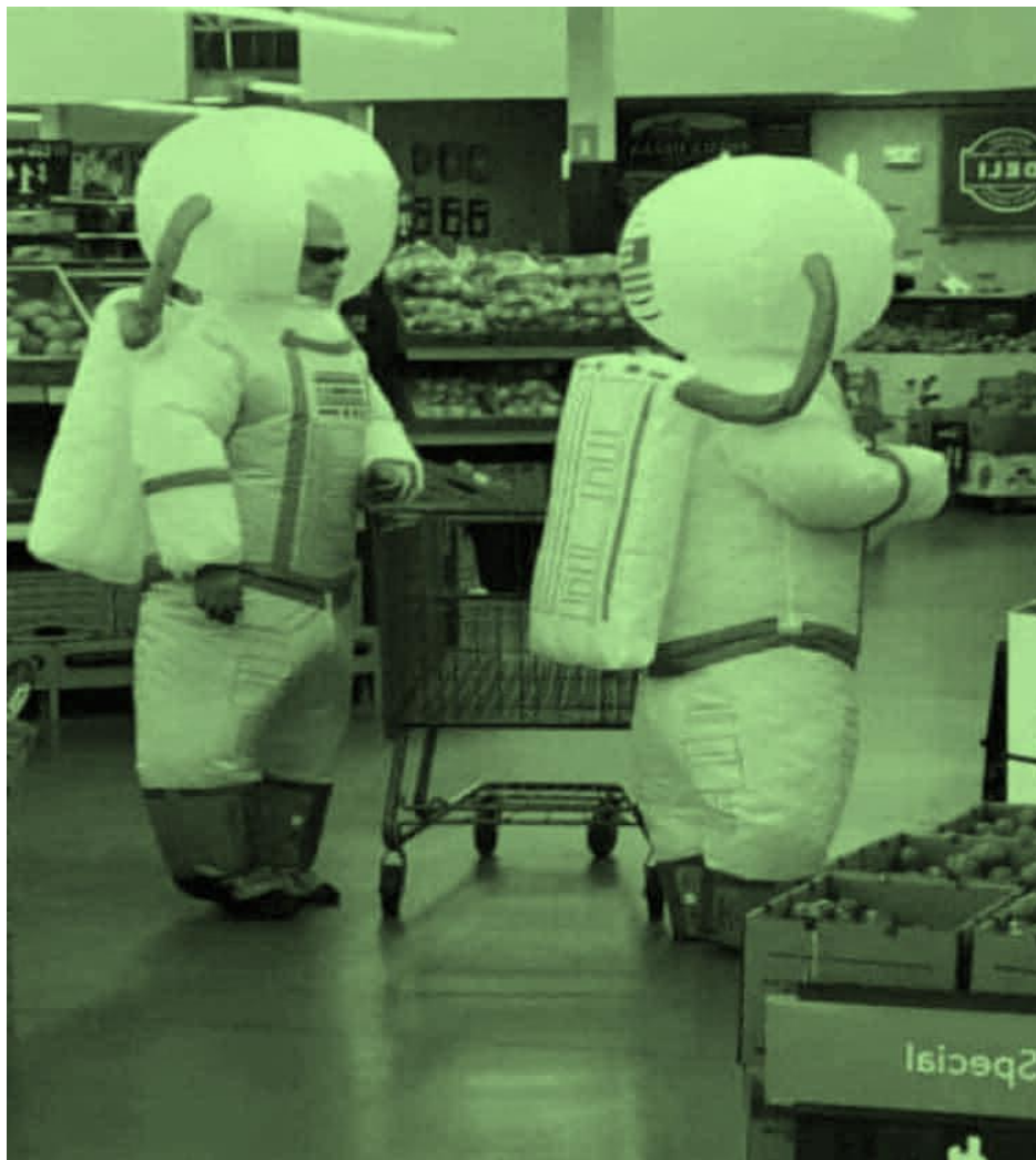
Escena de supermercado Autor desconocido 2020